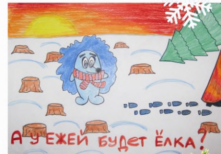
рисунок Архиповой Саши, 11 «Б»