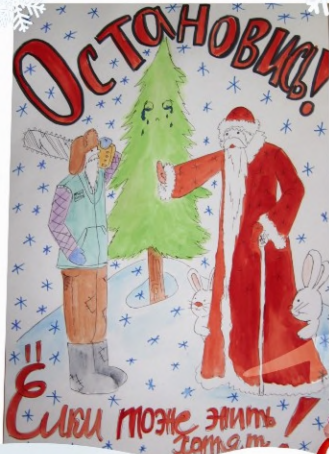
рисунок Феневой Юлии, 11 «Б»